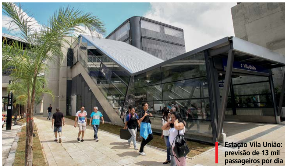
Estação Vila União: previsão de 13 mil passageiros por dia