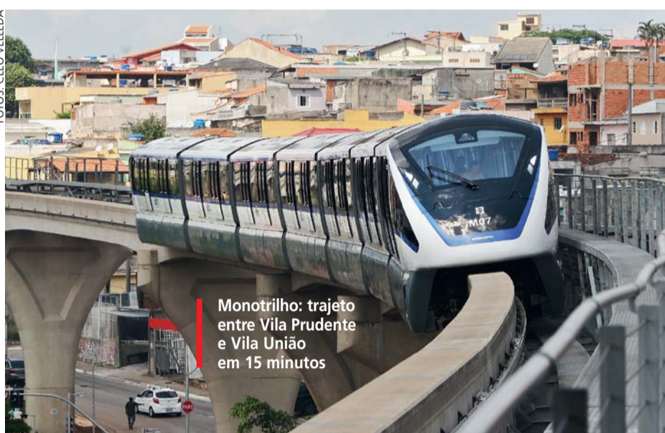
Monotrilho: trajeto entre Vila Prudente e Vila União em 15 minutos